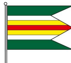
Obrázok 3 Vlajka obce

Vlajka obce Rejdová pozostáva zo siedmich pozdĺžnych pruhov vo farbách 2/9 zelená, 1/9 biela, 1/9 žltá, 1/9 červená, 1/9 žltá, 1/9 biela, 2/9 zelená. Vlajka má pomer strán 2:3 a ukončená je tromi cípmi, t.j. dvoma zástrihmi, siahajúcimi do tretiny jej listu.