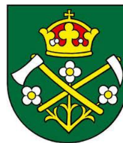
Obrázok 2 Erb obce

Erb obce Rejdová tvoria v zelenom štíte tri strieborné zlatostredé štvorlúpeňové ružičky na zlatých, dolu spojených listnatých stopkách, prekrytých zlatými poriskami strieborných skřížených nástrojov - sekerky a kopáča, to všetko prevýšené zlatou, perlami zdobenou a purpurou vystlanou uzavretou korunou.